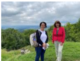
Begleitung des Besuchs der Staatssekretärin Gisela Erler aus dem Finanzministerium in meinem Wahlkreis - hier auf dem Hohenstaufen