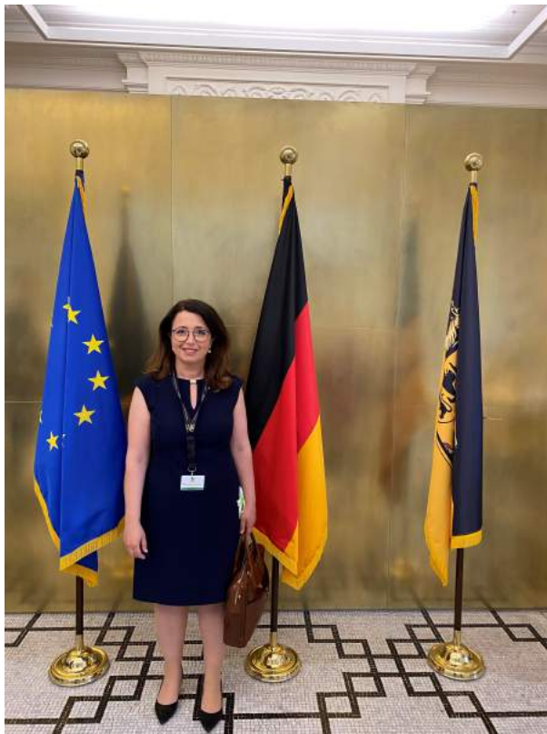
Auf Einladung unseres Ministerpräsidenten Winfried Kretschmann in der Villa Reitzenstein