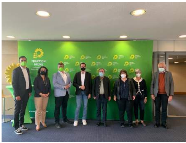
Unser Arbeitskreis für Recht und Verfassung, der dem "Ständigen Ausschuss" zugehört, bekommt oft Besuch von externen Gästen