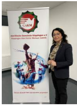
Mein Besuch bei der Alevitischen Gemeinde Göppingen e.V.