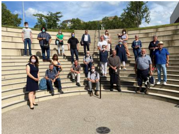
Besuchergruppe aus meinem Wahlkreis Göppingen im Sommer 2021