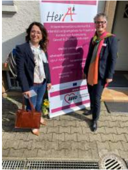
Besuch der AWO in Göppingen