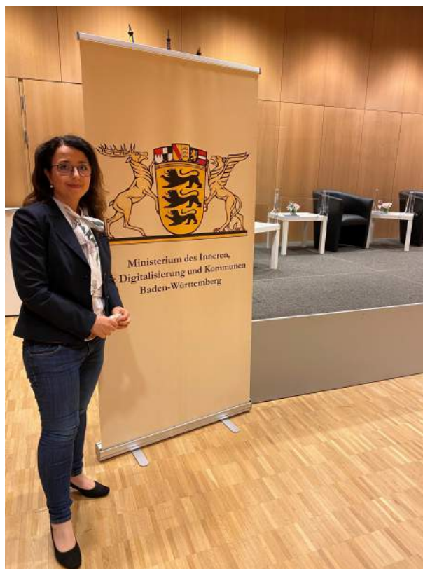
Feierliche Einsetzung der Polizeirabbiner in Baden und in Württemberg im Innenministerium