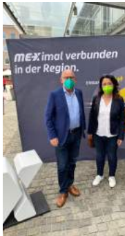
Mit Verkehrsminister Winfried Hermann bei der Eröffnung des MEX Zugs im Filstal - hier am Bahnhof Göppingen