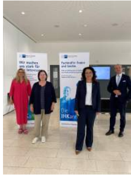
Besuch bei der IHK Göppingen