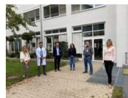
Besuch der Geschäftsleitung und Chefarzte im Klinikum Christophsbad Göppingen