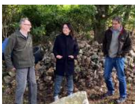
Naturschutzgebiet Hohenstaufen mit Andre Baumann, Staatssekretär im Ministerium für Umwelt, Klima und Energiewirtschaft, und Wolfgang Rapp (NABU)