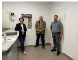
Besuch beim Kreisbauernverband Göppingen und Ostalb-Heidenheim