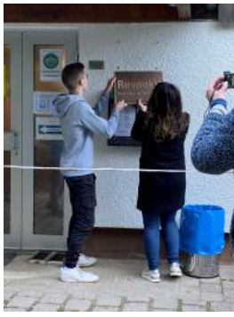
Nach meiner Rede – Anbringen des RESPEKT-Schildes am Boßlerhaus in Gruibingen