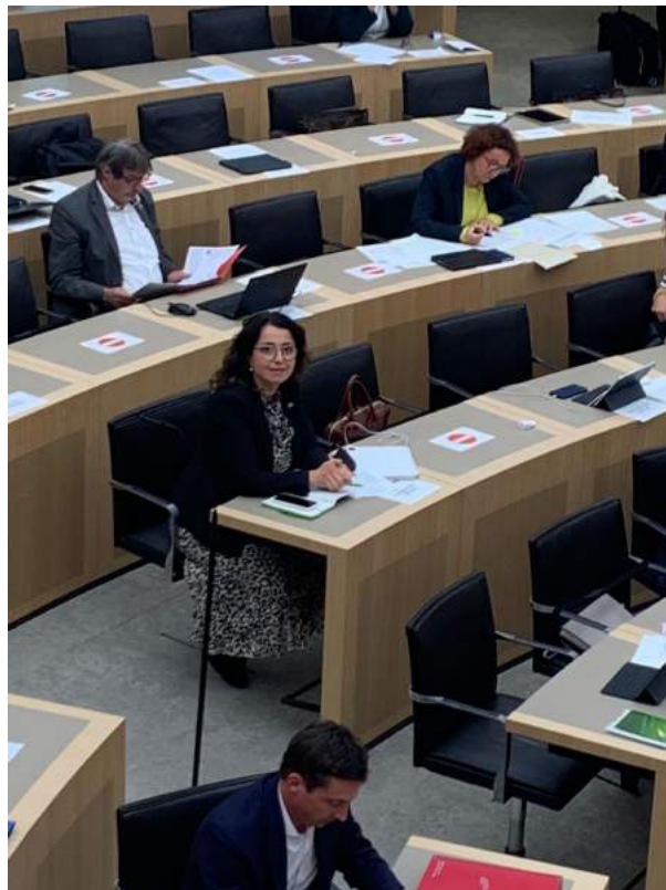
Plenarsitzung im Landtag von Baden-Württemberg

Eine Auswahl von Eindrücken aus meiner bisherigen Arbeit in Stuttgart