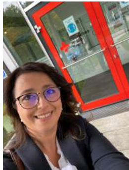
Besuch beim Deutschen Roten Kreuz - Kreisverband Göppingen