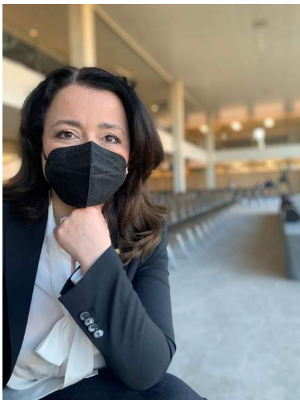
Kurz vor meiner ersten Plenarrede