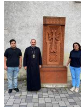
Mein Besuch bei der Armenischen Gemeinde Baden-Württemberg in Göppingen-Bartenbach