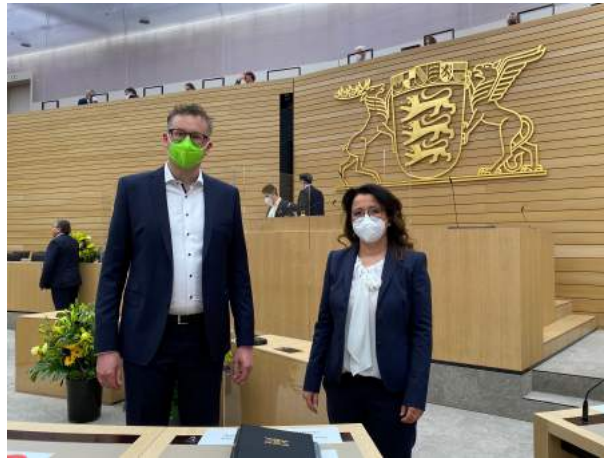
Konstituierung des 17. Landtags von Baden-Württemberg