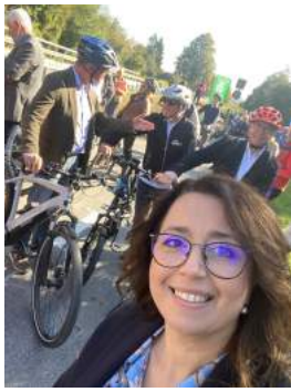
Eröffnung des Radschnellweg-Abschnittes zwischen Ebersbach und Reichenbach/Fils